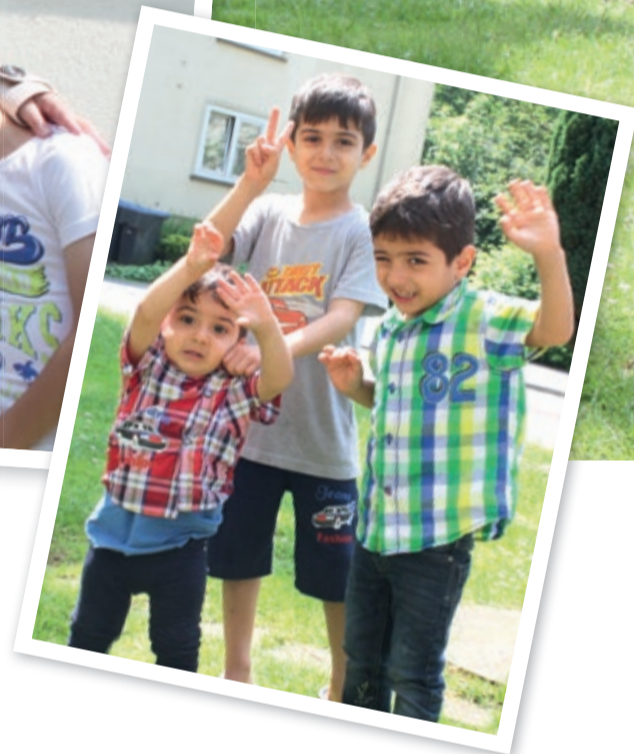
Vielfalt in Lünen: Angekommen in der neuen Heimat

Flüchtlingshilfe: „Es ist ein Segen, dass die AWO so gut vernetzt ist“