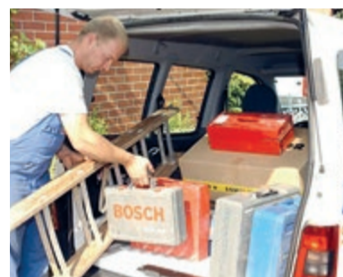
Künftige Arbeitsfelder für einen Sozialen Arbeitsmarkt