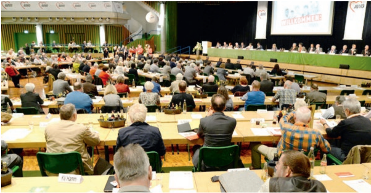
Die Bezirkskonferenz der AWO Westliches Westfalen kam in der Stadthalle Hagen zusammen.

„Willkommen: In der AWO“ – Unter diesem Motto lud die AWO Westliches Westfalen im Mai zur Bezirkskonferenz in die Stadthalle Hagen. Vertreter aus Verband und Politik waren zu Gast, darunter neben dem AWO-Bundvorsitzenden Wolfgang Stadler auch Rainer Schmeltzer, Minister für Arbeit, Integration und Soziales des Landes NRW. Rund 300 Delegierte stellten die personellen und politischen Weichen für die kommenden vier Jahre.