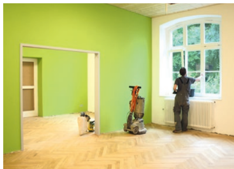
Holzfußböden, viel Licht und helle Farben: Die Kinder werden sich in dieser freundlichen Atmosphäre wohlfühlen. Bald sind die Renovierungsarbeiten abgeschlossen und sie können hier einzug halten.

Eine Gruppe ist nicht zuletzt aufgrund des Wegfalls einiger kirchlicher Kindergartenplätze vor Ort bereits ausgebucht. In der Gruppe der ganz Kleinen sind noch einige Plätze frei. Durch die Erweiterung des Familienzentrums entstehen sieben neue Arbeitsplätze.